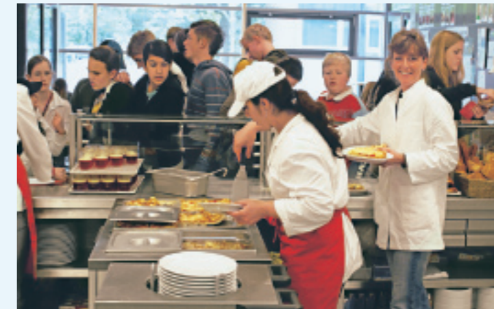
Frisch gekocht auf den Tisch: Das Hamburger Marienthal-Gymnasium gehört zu den wenigen Schulen, die noch eine eigene Küche haben. Die Zubereitung übernimmt ein gemeinnütziger Weiterbildungsbetrieb